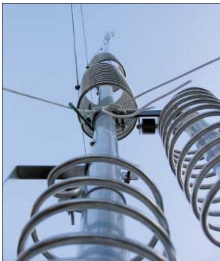
Bild 7: Gesamtansicht der HF9V von unten

Es fiel auf, dass es sich um eine sehr ruhige Antenne handelt, die wenig lokales QRM einfängt. Auch sendeseitig kommt man bereits mit einem 100-W-Transceiver gut heraus, wie die Funkpartner bestätigten. Die Mittenfrequenzen sind allerdings teilweise merklich von den Erdverhältnissen